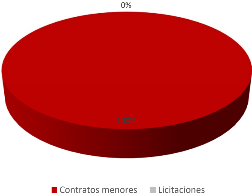
% SOBRE COLUMEN DE ADJUDICACIÓN