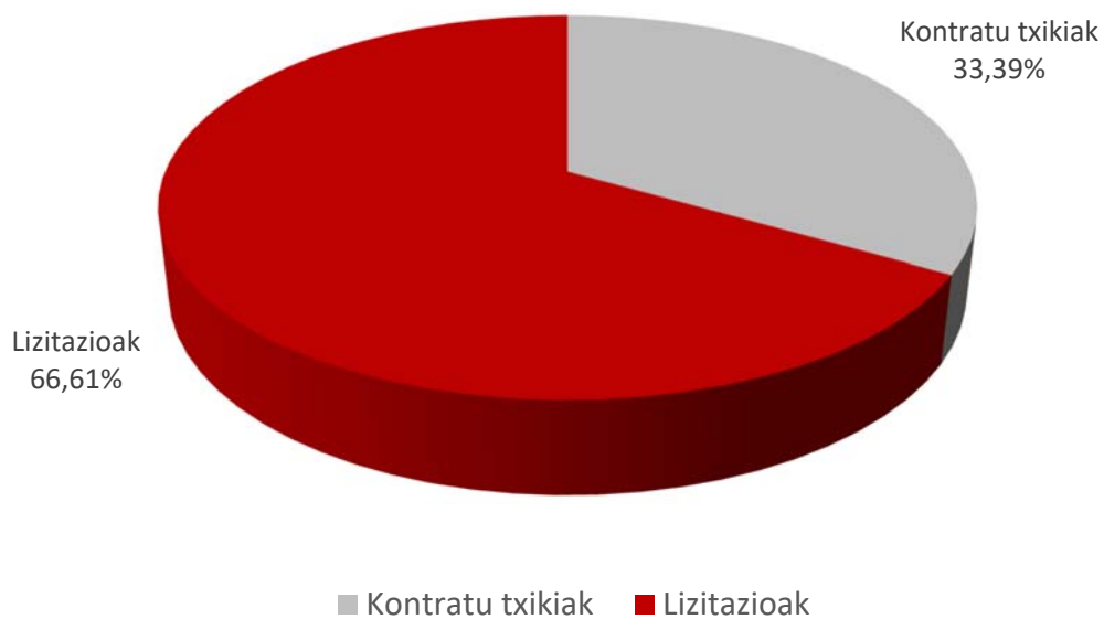
ESLEIPEN-BOLUMENAREN GAINEKO %