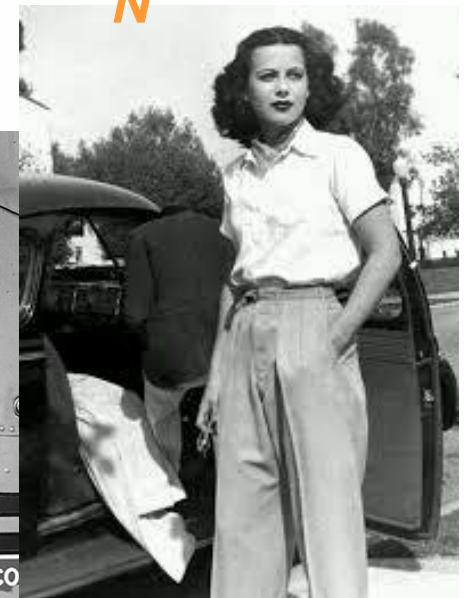
Hedy Lamarr inventora de la primera versión del espectro ensanchado que permitiría las comunicaciones inalámbricas de larga distancia.