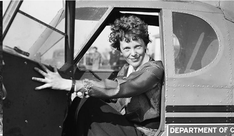
Amelia Earhart, aviadora célebre por sus marcas de vuelo y por intentar el primer viaje aéreo alrededor del mundo sobre la línea ecuatorial.