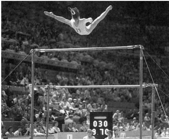
Nadia Comăneci, la primera atleta en conseguir una calificación de 10 puntos (calificación perfecta) en una competición olímpica de gimnasia artística.