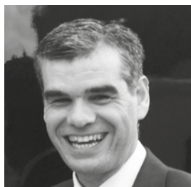
Gonzalo Serrats Ope Consultores